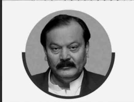
رانا محمد قاسم نون وفاقی وزیر وچیمین پارلیمنٹری سینیٹر کشمیر

آج کے دن پوری پاکستانی قوم اپنے کشمیری بھائیوں اور بہنوں کے ساتھ غیر متزلزل یکجہتی کا اظہار کرتی ہے۔