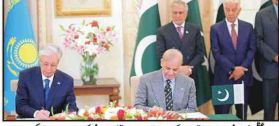
وزیر اعظم شہباز شریف اور وزیر اعظم ایران ڈاکٹر رضا امیری کے ملاقاتیوں کے ساتھ میٹنگ کے دوران۔

دو طرفہ تعلقات مزید مضبوط بنانے پر اتفاق، ملاقات میں پاک ایران دو طرفہ تعلقات، تجارت، توانائی، سرمایہ کاری اور خطے کی مجموعی صورتحال پر تفصیلی تبادلہ خیال وزیر اعلیٰ کی ایرانی سرمایہ کاروں کی زراعت، انفارمیشن ٹیکنالوجی اور سیاحت کے شعبوں سرمایہ کاری کی دعوت، دو طرفہ تعلقات، تجارت، توانائی اور علاقائی صورتحال پر بات چیت دونوں رہنماؤں کا پاک ایران تعلقات کو مزید مضبوط بنانے کے عزم کا اعادہ، ایرانی سفیر ڈاکٹر رضا امیری کا مقدم کی ملاقات پر وزیر اعظم پاکستان محمد شہباز شریف اور نائب وزیر اعظم محمد اسحاق ڈار کا شکریہ ادا کیا