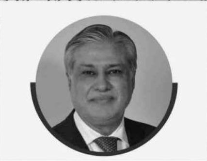
محمد اسحاق ڈار

ہم اپنے کشمیری بھائیوں اور بہنوں کو یقین دہانی کراتے ہیں کہ پاکستان ہمیشہ آپ کے شانہ بشانہ کھڑا رہے گا۔ پاکستان ہر فورم پر آپ کی آواز بلند کرتا رہے گا اور اخلاقی، سیاسی اور سفارتی سطح پر آپ کی حمایت جاری رکھے گا یہاں تک کہ انصاف فراہم کیا جائے اور آپ کو آپ کا وعدہ کردہ حق خودارادیت حاصل ہوجائے۔