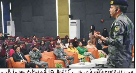
لاہور: ڈی جی کاؤنٹر ٹریننگ فورس پنجاب بریگیڈ نے منظر اقبال سٹی یونیورسٹی میں منشیات فروشی سے متعلق آگاہی سیمینار سے خطاب کر رہے ہیں

راولپنڈی پولیس کی کارروائیاں، زبردست افراد سے پیشہ ورانہ