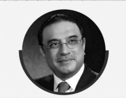
آصف علی زرداری

انشاء اللہ! تاریکی کے یون جلد آزادی کی روشن بحر میں بدل جائیں گے اور وہ دن دور نہیں جب جموں و کشمیر کے عوام بھارتی قبضے کی زنجیروں کو توڑ کر خوف سے آزاد مستقبل میں اپنی زندگیاں بسر کریں گے۔